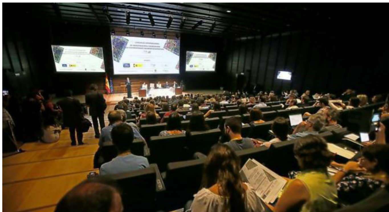
Imagen de la pasada edición del CIIEN en Alicante.

La VI edición del Congreso Internacional de Investigación e Innovación en Enfermedades Neurodegenerativas CIIEN , un punto de encuentro clave para investigadores de referencia nacional e internacional en enfermedades neurodegenerativas, se celebrará en Santiago de Compostela en el próximo mes de septiembre. El Congreso es organizado conjuntamente por la Fundación CIEN (Centro de Investigación de Enfermedades Neurológicas), la Fundación Reina Sofía y CIBERNED (Centro de Investigación Biomédica en Red de Enfermedades Neurodegenerativas).